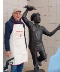
Besuch in Eberwalde